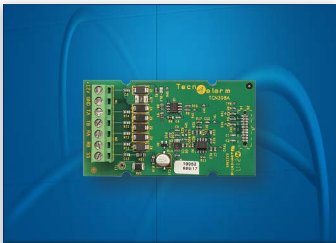
ESP GSM LINK F127ESPGSMLINK

La scheda di interfaccia opzionale ESP GSM LINK, tramite linea seriale dedicata RS422, collega TECNOCELL 3 sulla scheda CPU della centrale al posto del modulo di espansione ESP GSM-GPRS. TECNOCELL 3 viene così considerato dal Sistema come GSM (interno), pertanto la sua programmazione e la modalità di funzionamento rispecchiano quanto previsto per questo tipo di vettore. Questa modalità di utilizzo permette di decentrare la posizione del comunicatore per ottenere due vantaggi prestazionali: massimizzare il livello di segnale di campo e incrementare il livello di sicurezza intrinseco del Sistema, occultando il comunicatore. Anche l'utilizzo dell' ESP GSM LINK abbinato al TECNOCELL 3 su centrali TP10-42, TP8-88, TP20-440 permetterà il collegamento al TCS.